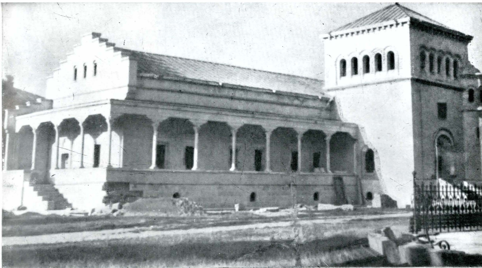
Sala gotică, după restaurare.

prezentate în sesiunile de comunicări științifice, inițiate încă din anul 1963. Comunicările au fost editate în patru volume apărute pînă în prezent, al 5-lea (sesiunea 1968) fiind în curs de apariție. În afară de comunicările referitoare la restaurări, sesiunile au cuprins și studii de ansamblu asupra unor grupuri de monumente, ca cele din Țara Făgărașului sau bisericile de lemn din Moldova, care au adus o însemnată contribuție pentru cunoașterea specificului unor monumente de pe teritoriul patriei noastre, al cărui studiu poate deschide capitole noi istoriei arhitecturii românești dintre secolele XVIII—XX.