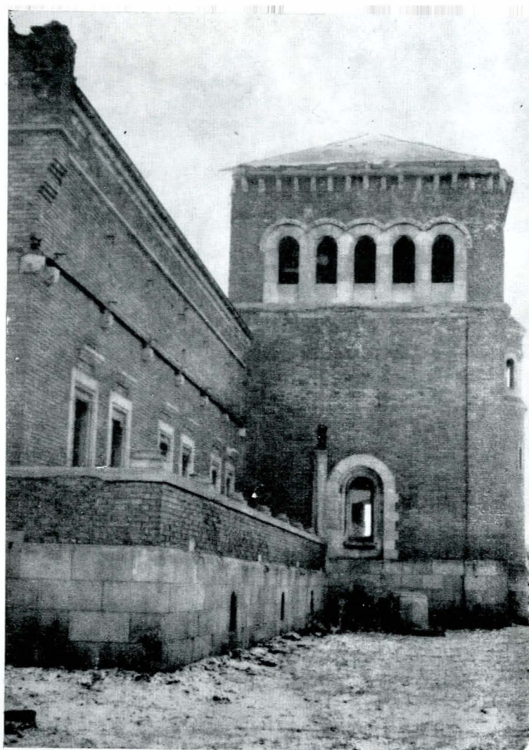
Complexul Trei Ierarhi (Iași). Sala gotică, înainte de restaurare.

Ca exemple din practica de restaurare condusă de acest principiu al conservării etapelor cu valoare artistică și istorică, se pot cita lucrările de punere în valoare a ansamblurilor monumentale Cozia, Strehaia și Hurezi, restaurarea bisericii romane din Cricău (cu evidențierea tuturor fazelor de transformări, inclusiv urmele bolților gotice păstrate sub acoperișul actual al monumentului) de asemenea, restaurarea bisericii cisterciene din Prejmer (cu evidențierea transformărilor succesive care atestă o evoluție pe parcursul a trei secole, de la tranziția romanului spre gotic, pînă la ultimele faze ale goticului tîrziu) precum și conservarea pridvorului adăugat în secolul XVIII pe fațada de vest a bisericii mănăstirii Mărcuța, iar — în momentul cînd — pridvorul adăugat în secolul al XIX-lea bisericii Slobozia din București.